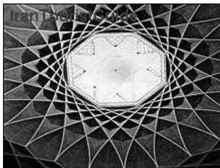
شکل ۱-۳ یک اثر معماری

گاه برای نشان دادن یک دستگاه، شیء یا رویداد، تنها از عکس می‌توان کمک گرفت. هرگاه جزء خاصی از عکس مورد نظر است، باید به‌گونه‌ای تهیه شود که اجزای فرعی چشمگیرتر از جزء مورد نظر نباشد (شکل ۱-۲).