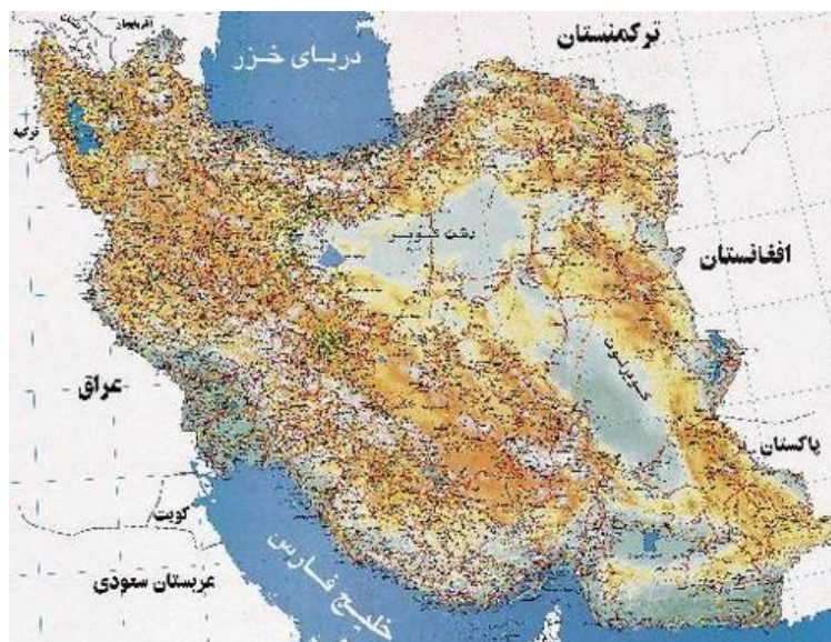
نقشه ۱-۳ نقشه ایران

ف ۳/ چگونگی استفاده از تصویر/ شکل در متن ۳۵